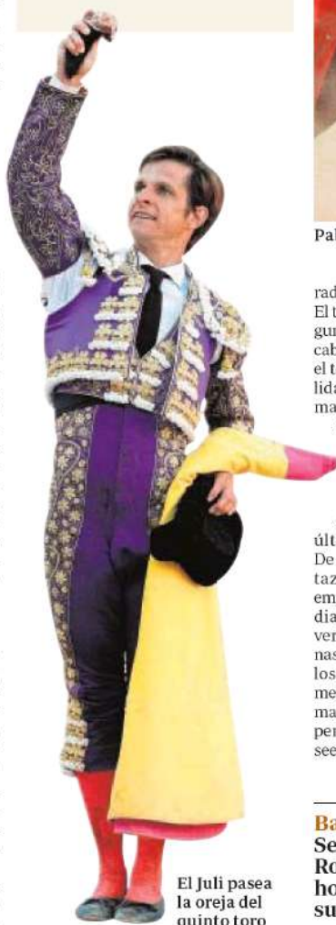
El Juli pasea la oreja del quinto toro

PABLO AGUADO , de berenjena y oro. Estocada y descabello (saludos). En el sexto, media estocada (ovación de despedida).