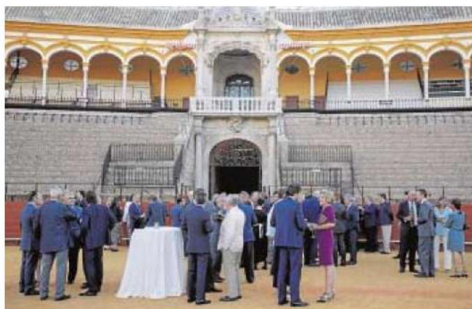
Un momento del cóctel servido en el ruedo maestrante