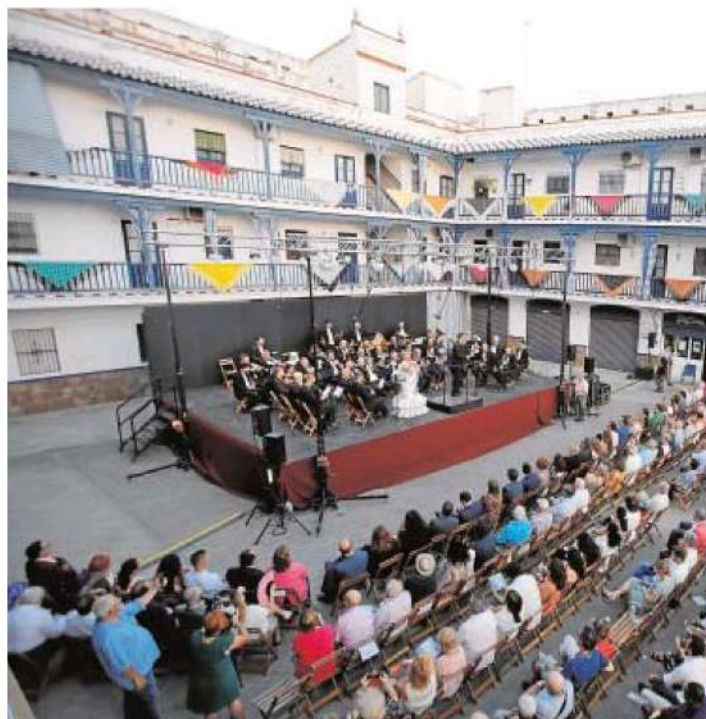
Imagen del hotel Triana donde se celebra cada año el acto de inauguración de la Ve