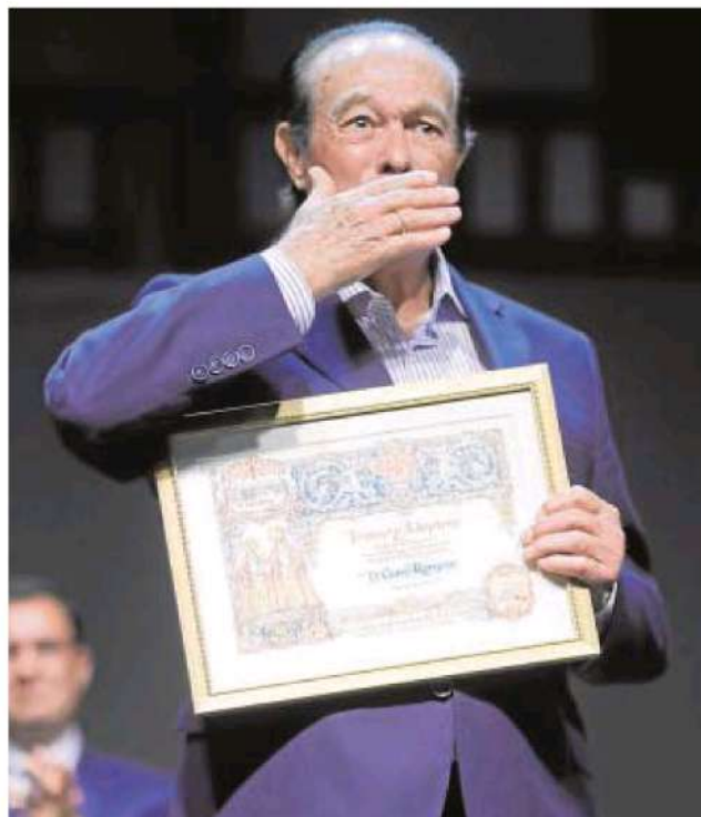
Curro Romero, emocionado, tirándole un beso al público