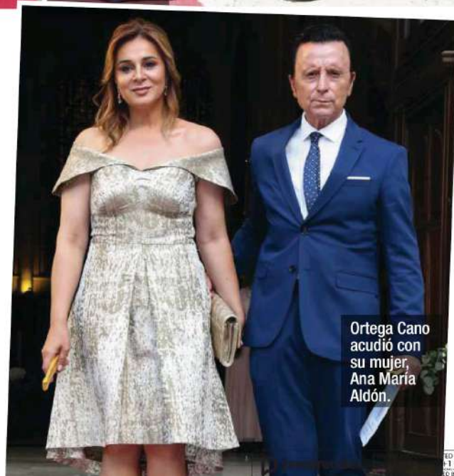
Ortega Cano acudió con su mujer, Ana María Aldón.