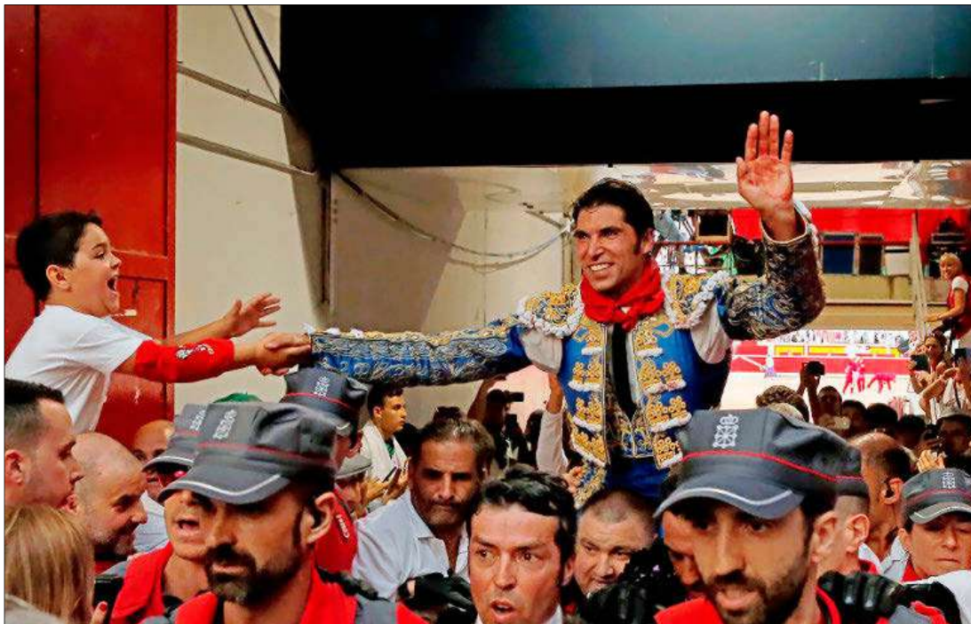
Un niño felicita a Cayetano en su salida a hombros por la puerta del encierro en la plaza de Pamplona.

Cayetano, de azul marino y oro. Estocada tendida (dos orejas). En el sexto, gran estocada (dos orejas y petición de rabo). Salíó a hombros.