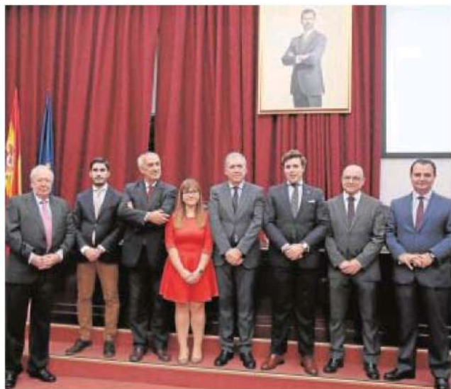
En la mesa redonda participaron historiadores y aficionados

Inquieto Tuvo el primer coche de Sevilla e introdujo en su pueblo el teléfono y la cámara fotográfica