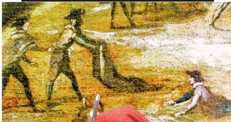
Detalle del aprendizaje del toreo en el lienzo «Vista del Real Alcázar y entorno del Puente de Segovia», 1670, Museo Slim-Soumaya (México)