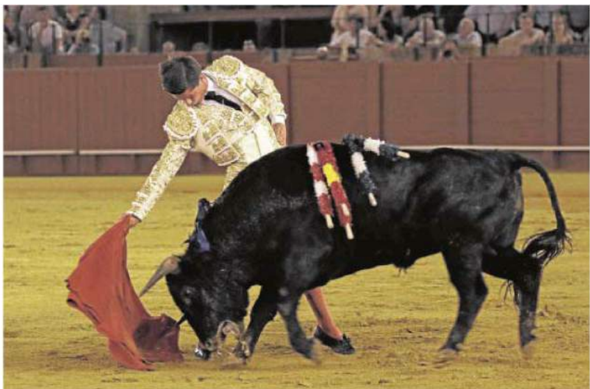
El joven de Toledo, con uno de novillos del buen encierro de Jandilla