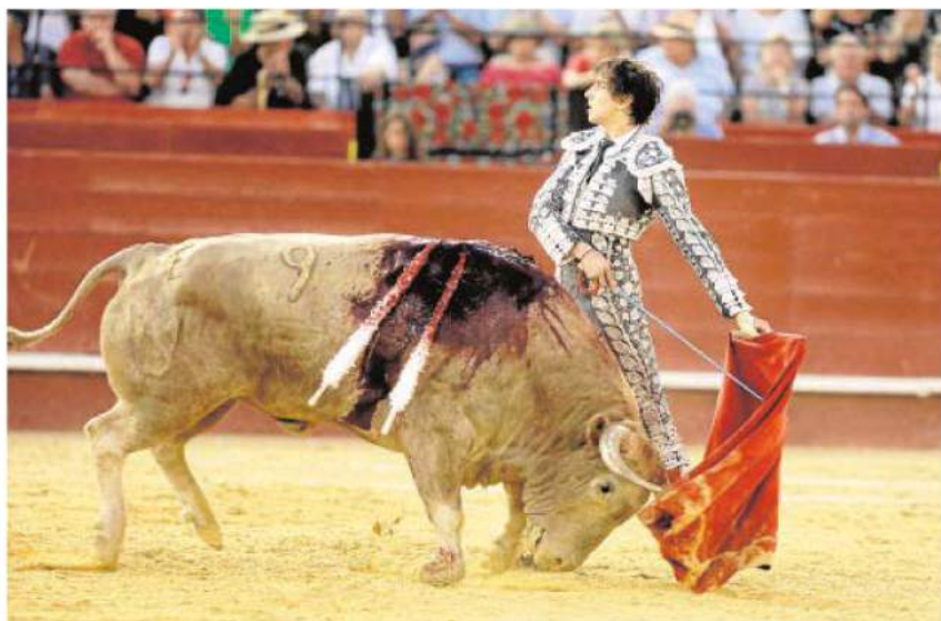
Andrés Roca Rey, en un muletazo mirando al tendido en el sexto de la tarde

Así las cosas, sus triunfos incontestables, golpe a golpe, en cada arena, se traducen en ese ruidito que genera un gran ambiente en taquilla.