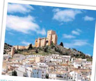
VÉLEZ RUBIO. La localidad natal de su abuela materna, junto al entorno del Cabo de Gata, ofrece a Serrano la paz interior que necesita