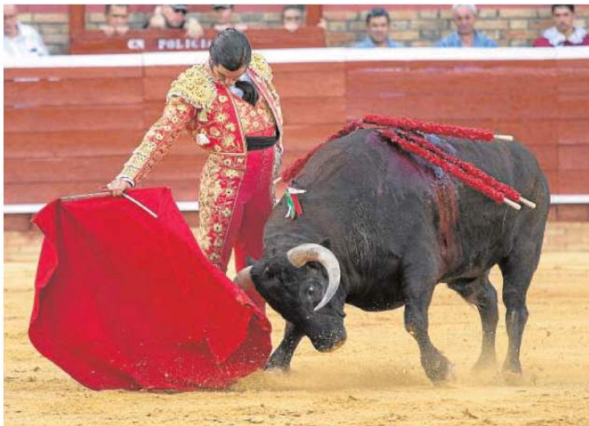
Morante de la Puebla, en un muletazo en redondo en la pasada feria de Las Colombinas