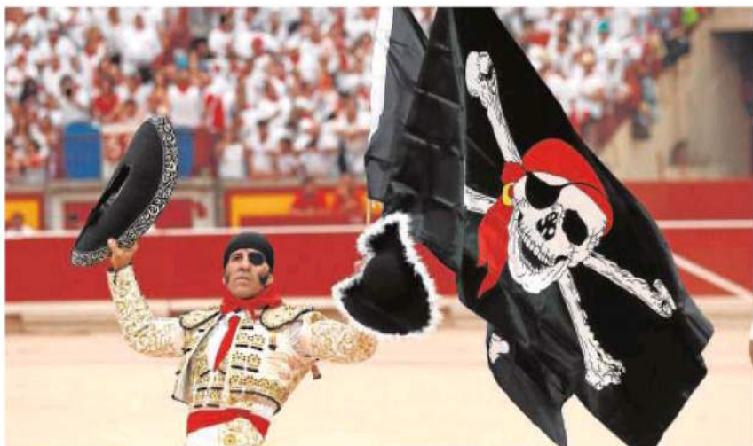
Juan José Padilla, con pañuelo en la cabeza, parche en el ojo y bandera pirata en mano, cortó tres orejas

ROCA REY , de gris plomo y plata. Pinchazo y gran estocada (oreja). En el sexto, gran estocada (dos orejas). Sale a hombros.