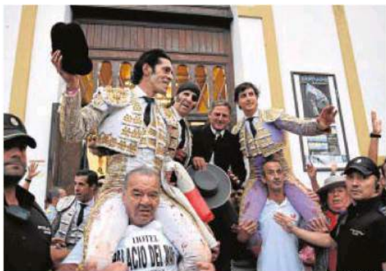
La terna y el mayoral salen a hombros en el broche de feria

Una gran corrida de Algarra Polera. Sólo Ureña, en el quinto, ha estado a su altura. Los dos salen a hombros: todos, felices.